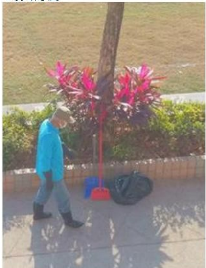
民叔勤奮工作，保持我們的校園環境清潔健康