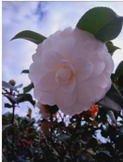
茶花（“冬季玫瑰”）在校園裡綻放美麗