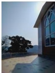
新的後走道和新的白色欄杆