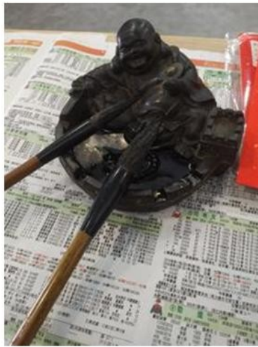
笑佛墨壺和李伯的兩把毛筆