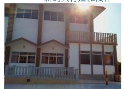
帶有新欄杆的景輝堂