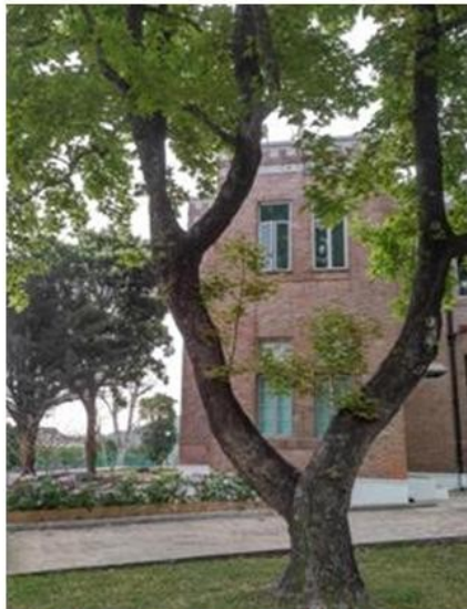
有81年歷史的行政大樓外邊的叉骨樹