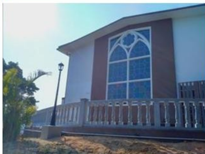
景輝堂的新防水屋頂