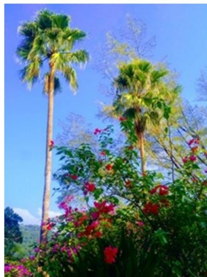
棕櫚樹在陽光明媚的藍天中搖曳