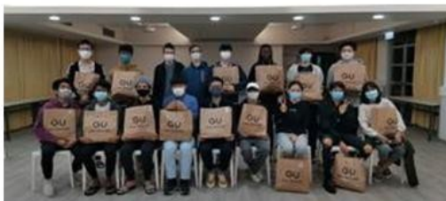
學生攜帶他們的GU手提袋冬季用品

我相信，這些微小的禮物將會成年輕學生心中愛的種子，它們將會成長並結出美麗的果實。此外，香港三育書院的學生很可能會成為主的忠心僕人，與將來有需要的人慷慨分享。因此，對基督的愛就像迴旋鏢一樣，並且會轉出越來越多的祝福，超越了我們所學的一般數學概念。就像一滴水落入大海，與他。人共享的愛和同情心向外泛起並呈指數增長。