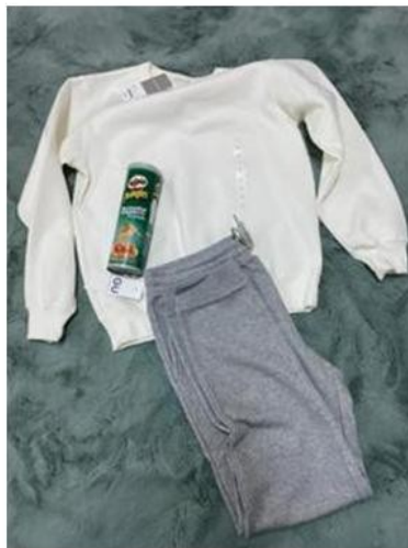
寒衣和薯片搭配得非常好！

作為一個校牧為學生工作，以及作為父親的我，這使我深感到學生生活在非常寒冷的環境中。因此，在誠懇祈禱之後，我聯繫了一些韓國教會牧師，並就“冬季服裝贊助項目”向他們呼籲。當我的牧師們聽到這個項目時，他們非常讚同和理解我的關切，並願意分享超越國界的基督的愛。多虧了我同胞的愛與同情，我才得以為香港三育書院宿舍的學生提供可以暖身的食物，暖手器和冬衣。