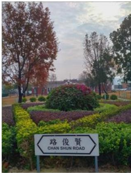
前門入口新安裝的路標賢俊路