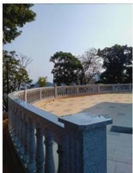
新的後走道和新的白色欄杆