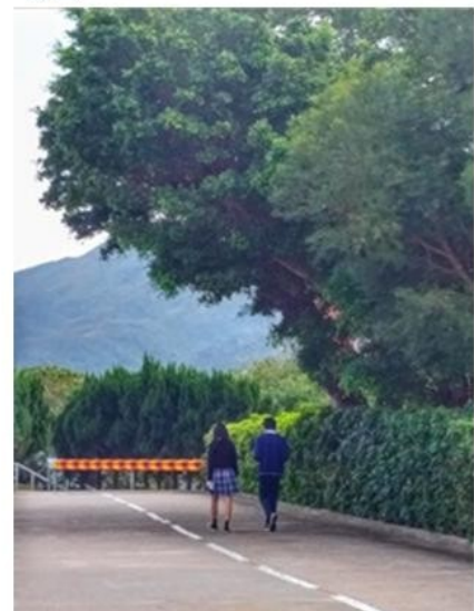
年輕的愛情通過交談和慢步找到自己的方式