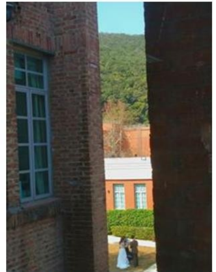
新娘和新郎在幸福的儀式前排練誓言