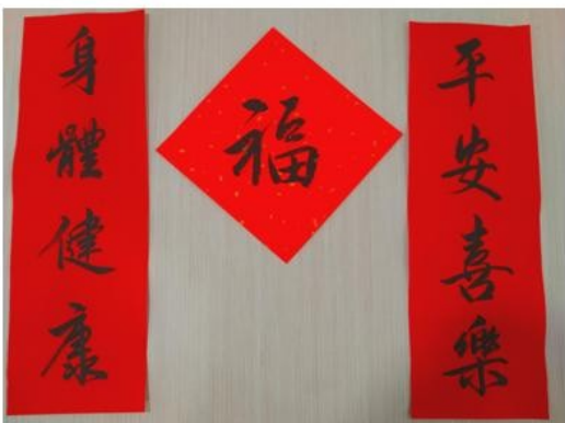
賀年揮春祝各人身體健康，吉祥，平安，幸福