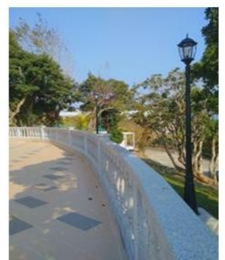
新的人行道和欄杆