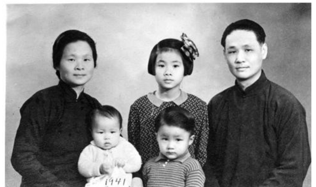
梁社長牧師的一家合照