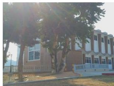
帶有新欄杆的景輝堂 Page 5